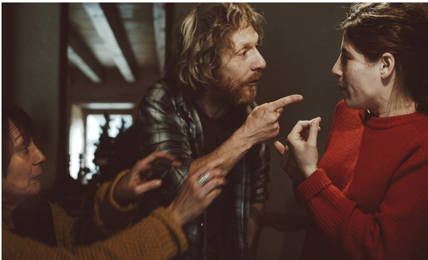
ANA

D comme Depardieu , tant le corps de Gérard Depardieu irradie dans son cinéma.