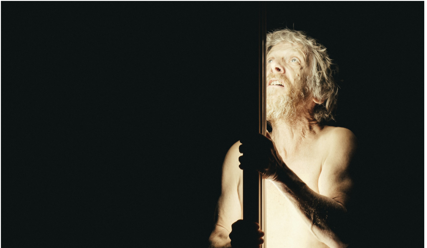
ANA - © Florian Bardet

On retrouvera des scènes qui figuraient dans la dernière version du scénario, mais qui n'ont pas été tournées, ou n'ont pas été gardées au montage . Notamment un long et très beau monologue de Suzanne, où elle évoque de graves troubles psychiques, apparus six mois après la mort de son père. Récit sans doute très peu cinématographique, mais d'une grande force d'écriture.