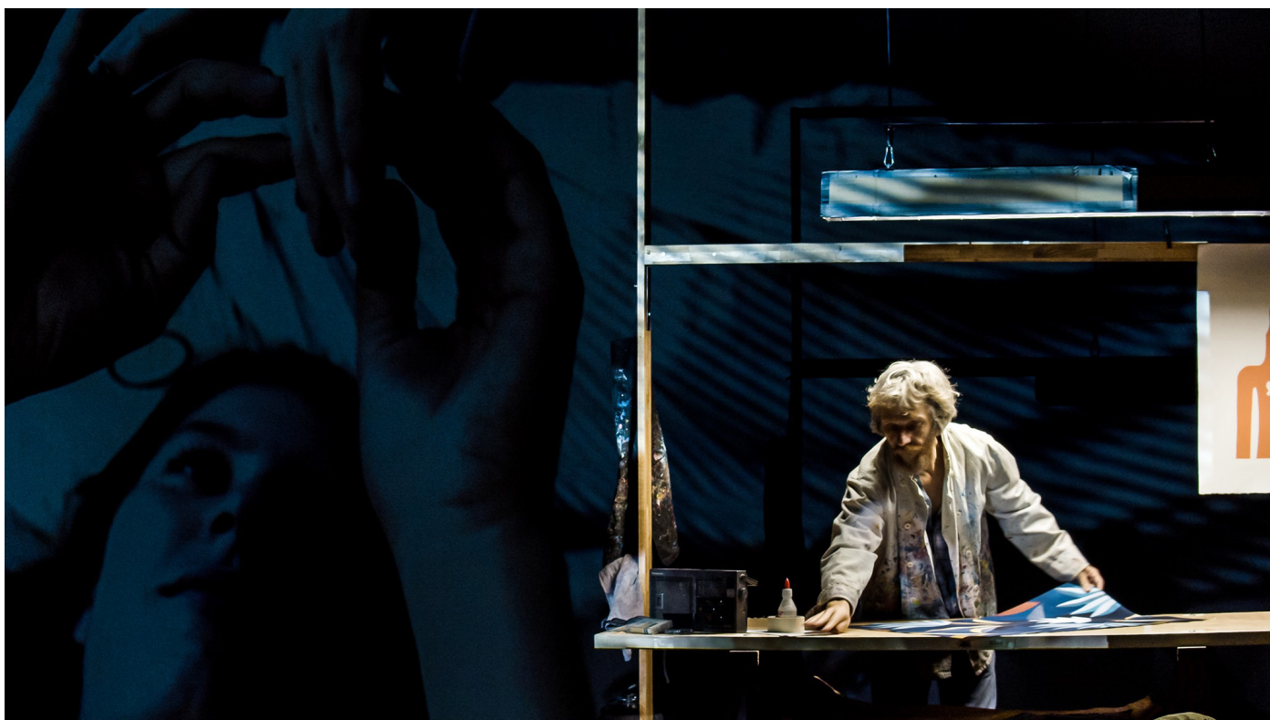
ANA, © Florian Bardet

La caméra traque les personnages pour leur faire rendre, sinon l'âme, du moins leur vérité. La longueur des plans ou des scènes est le résultat de ces corps à corps où la violence est là sans qu'on l'ait vue arriver, et perdue jusqu'à l'épuisement des combattants.