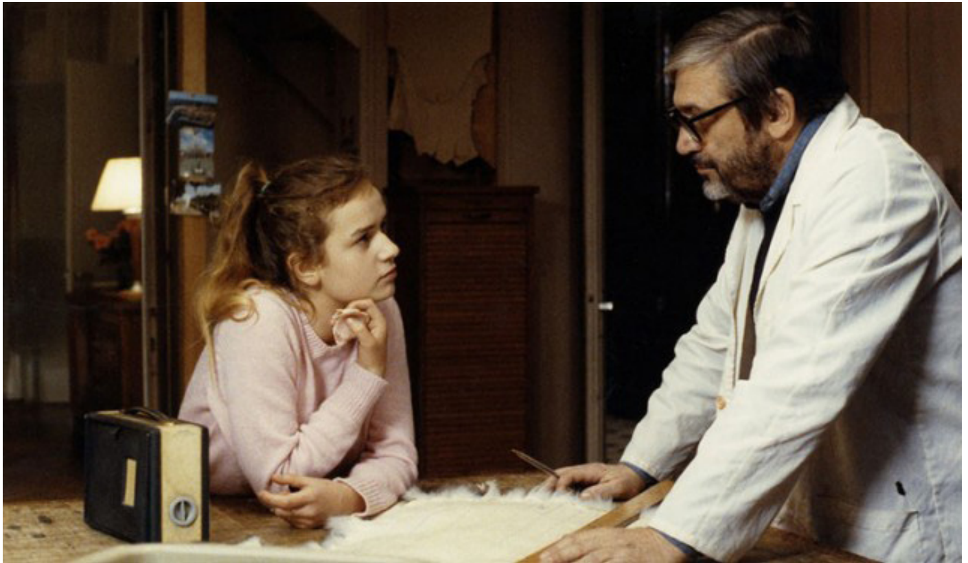
A nos Amours, 1983

Suzanne a quinze ans. En vacances sur la Côte d'Azur, elle repousse Luc, le jeune homme qui est amoureux d'elle, puis se donne à un Américain inconnu sur la plage. De retour à Paris, elle multiplie les aventures amoureuses. Ses parents se séparent. Son père quitte la maison. Elle doit faire face à l'hostilité de sa mère et de son frère. Son mariage se solde par un échec. Après avoir revu son père, elle part avec un amant aux États-Unis.