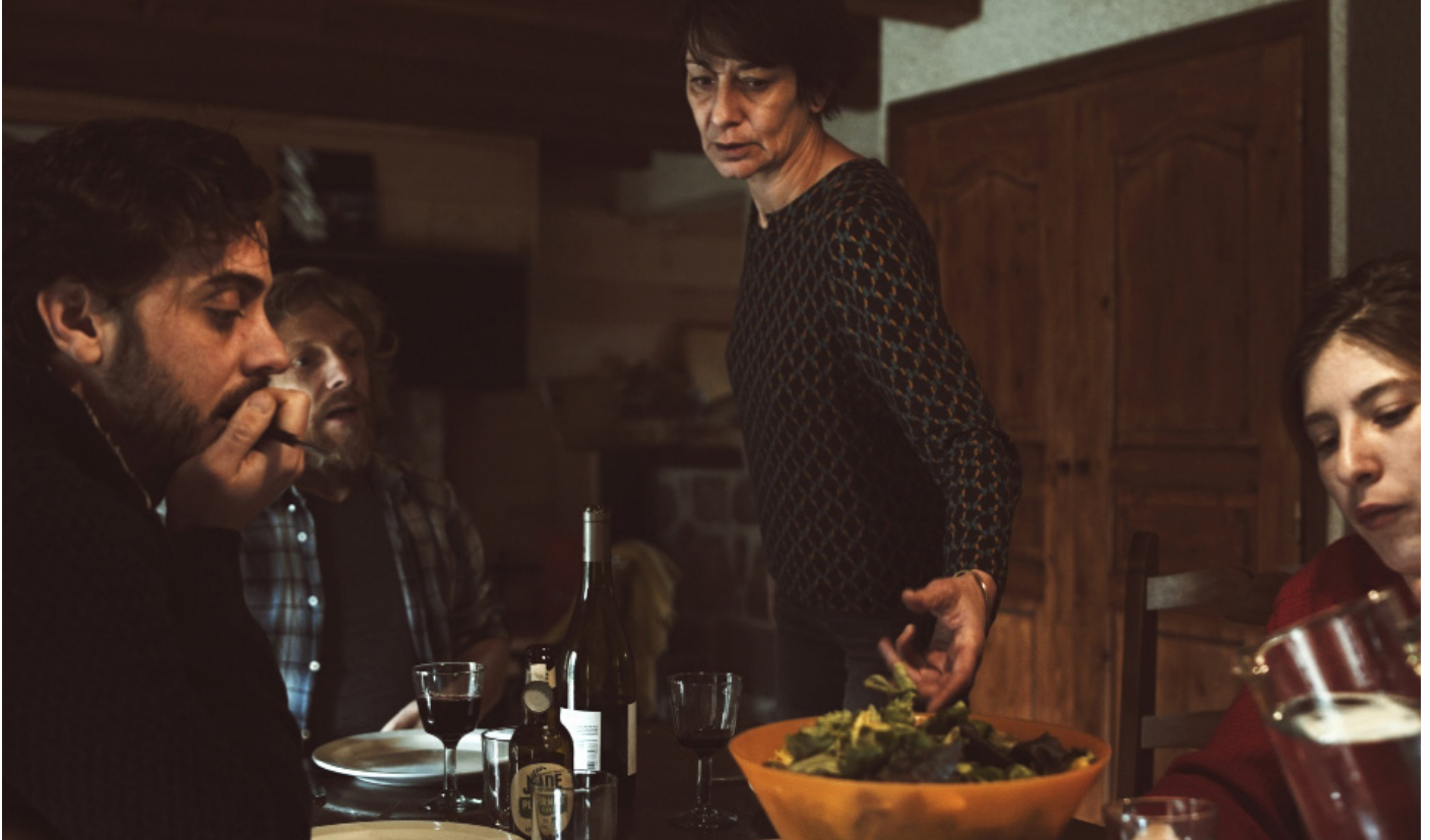
Répétition ANA

De très nombreux films sont des adaptations d'œuvres littéraires ou dramatiques. C'est beaucoup plus rare dans l'autre sens.