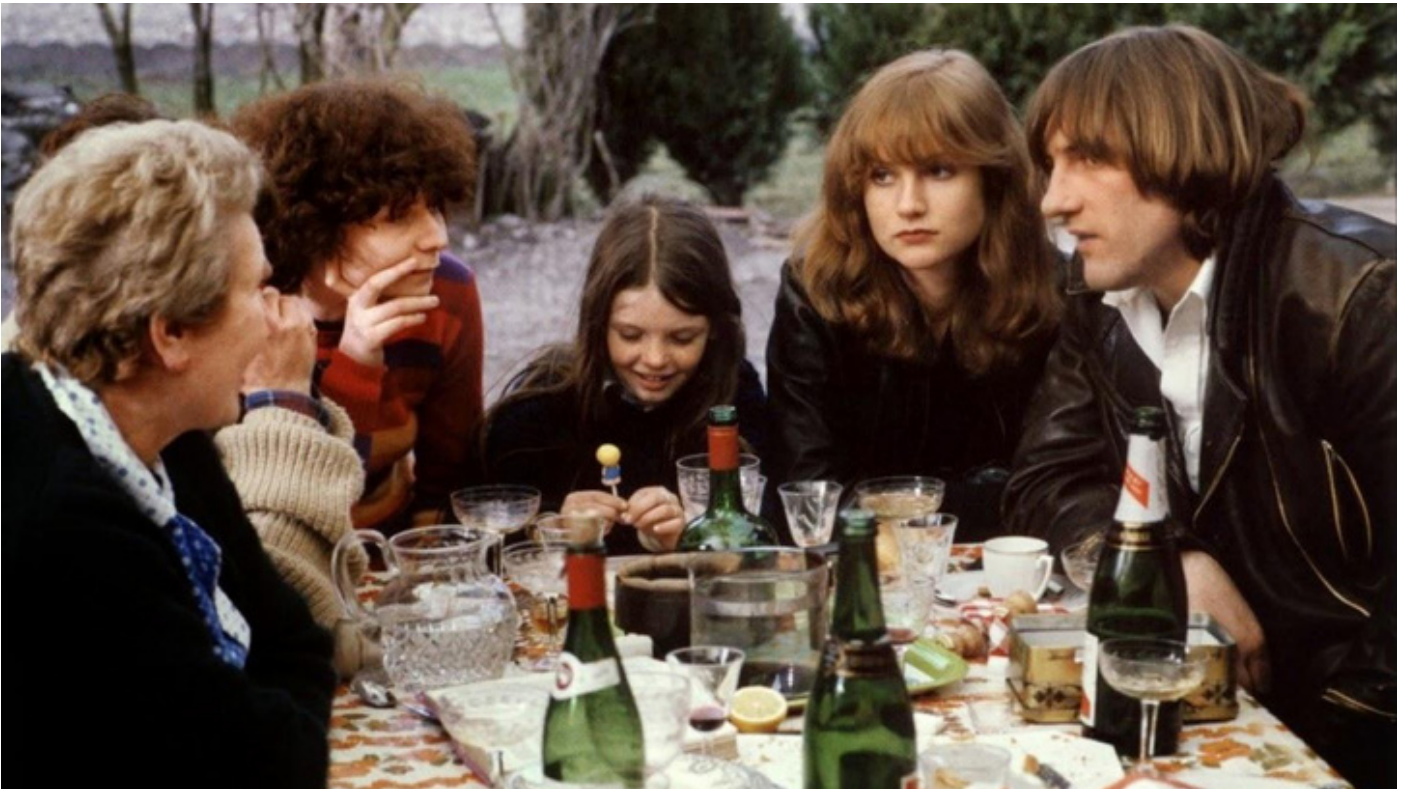
Loulou , 1980

Après toutes ces lectures, j'ai senti la nécessité de rencontrer des personnes intimement liées à Maurice Pialat, qui ont participé au film, ou y ont consacré une part de leur travail. Je voulais leur parler de mon désir d'adapter A nos amours au théâtre, leur soumettre les quelques intuitions que j'avais, et les questionner pour continuer à avancer.