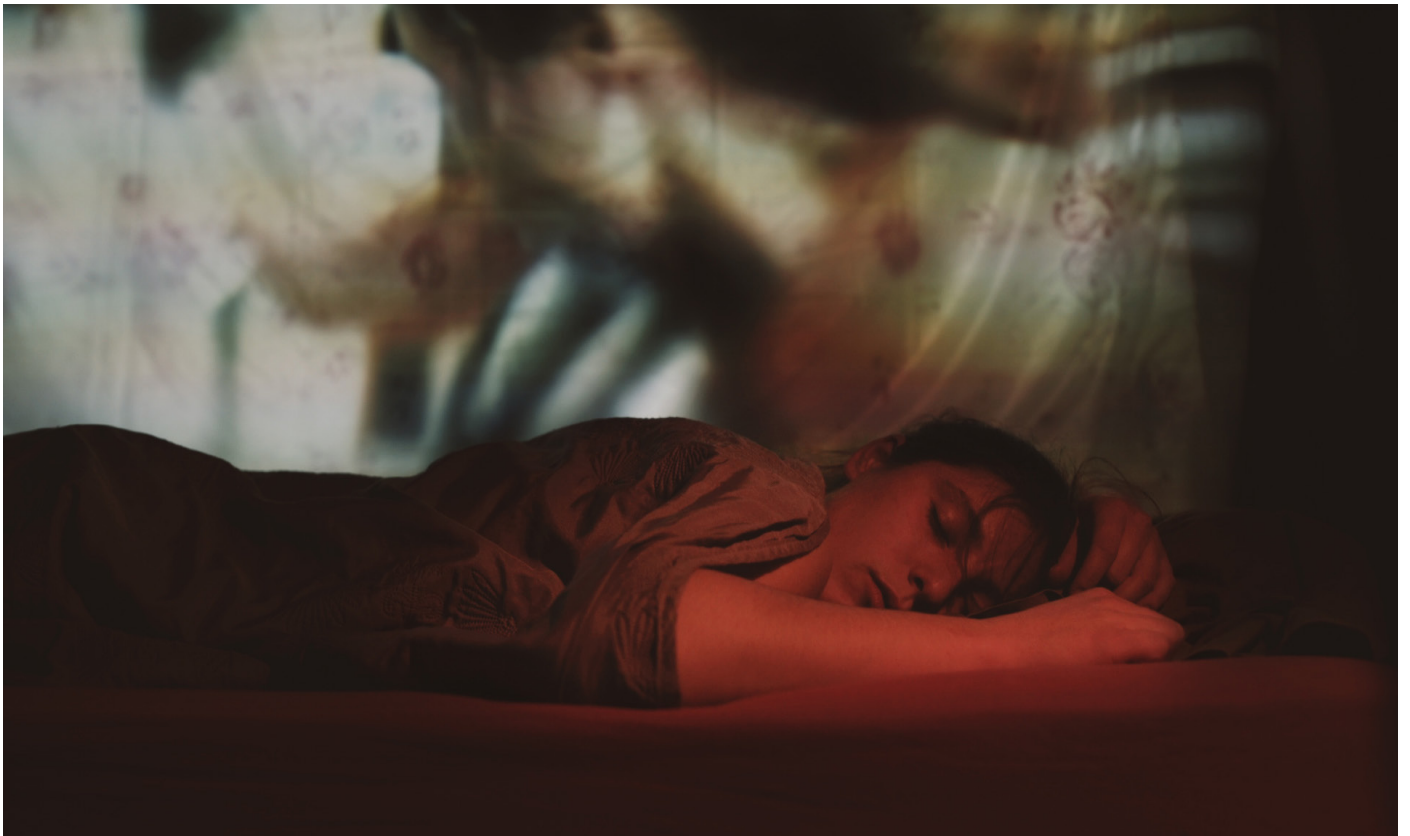
ANA - © Florian Bardet

Et l'émotion est très souvent là, toujours brutale, inattendue, fulgurante. Comme dans la vie.